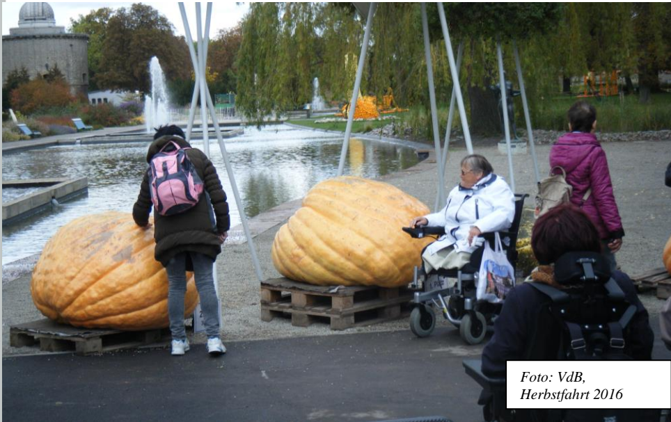
Herbstfahrt 2016

V e r b a n d d e r B e h i n d e r t e n